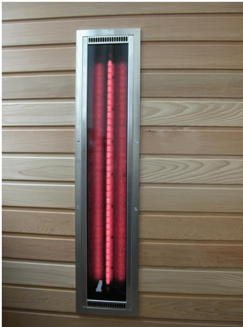
Der ROTlicht+ Infrarotstrahler, eingebaut in eine Red Cedar Kabinenwand.

Die Eigenschaften des Vollspektrums finden Sie ausführlich beschrieben im Kapitel ‚Saunafluter‘ und bei den herkömmlichen Vollspektrum Reflektorstrahlern, sodass wir hier nicht noch einmal darauf eingehen müssen.